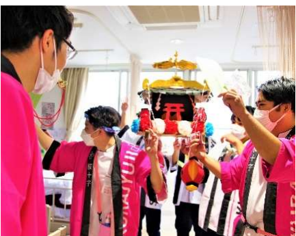
■ おみこしわっしょい